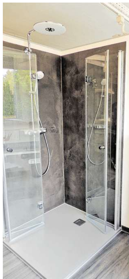
In der Ausstellung werden innovative Badsysteme präsentiert.